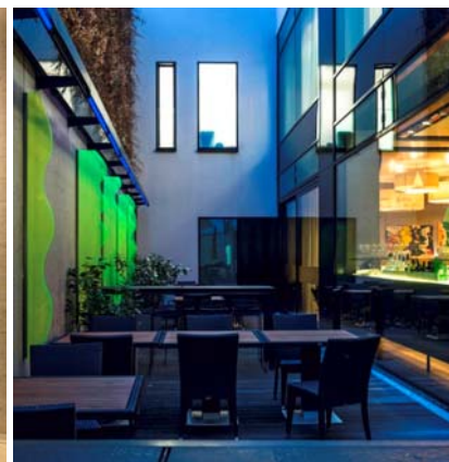
Hotel Barceló Hamburg, Kunst: Regine Schumann