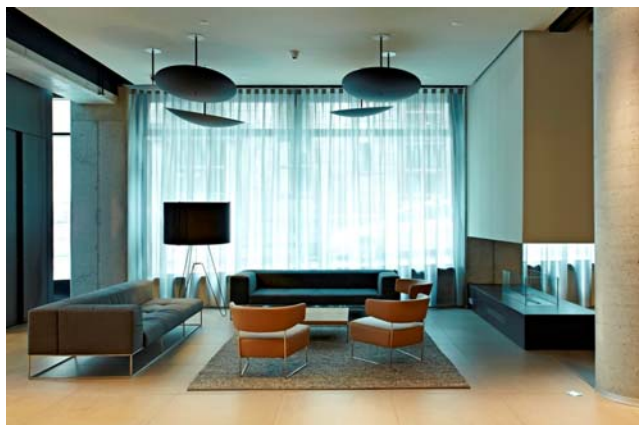
Hotel Barceló Hamburg